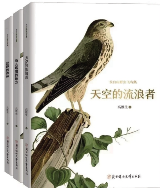
□通讯员 董剑 刘娟娟 高延新